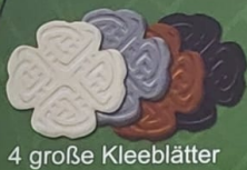
4 große Kleeblätter